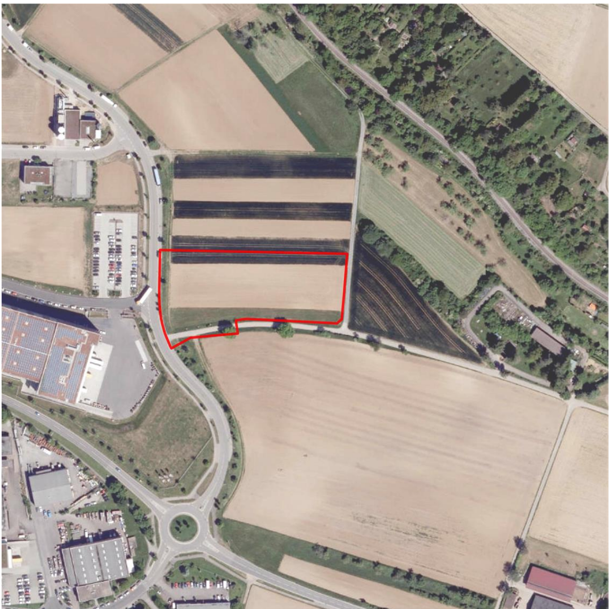
Luftbild mit Geltungsbereich Bebauungsplan „Gewerbegebiet nördlich der Münchinger Straße Teil III“ ohne Maßstab